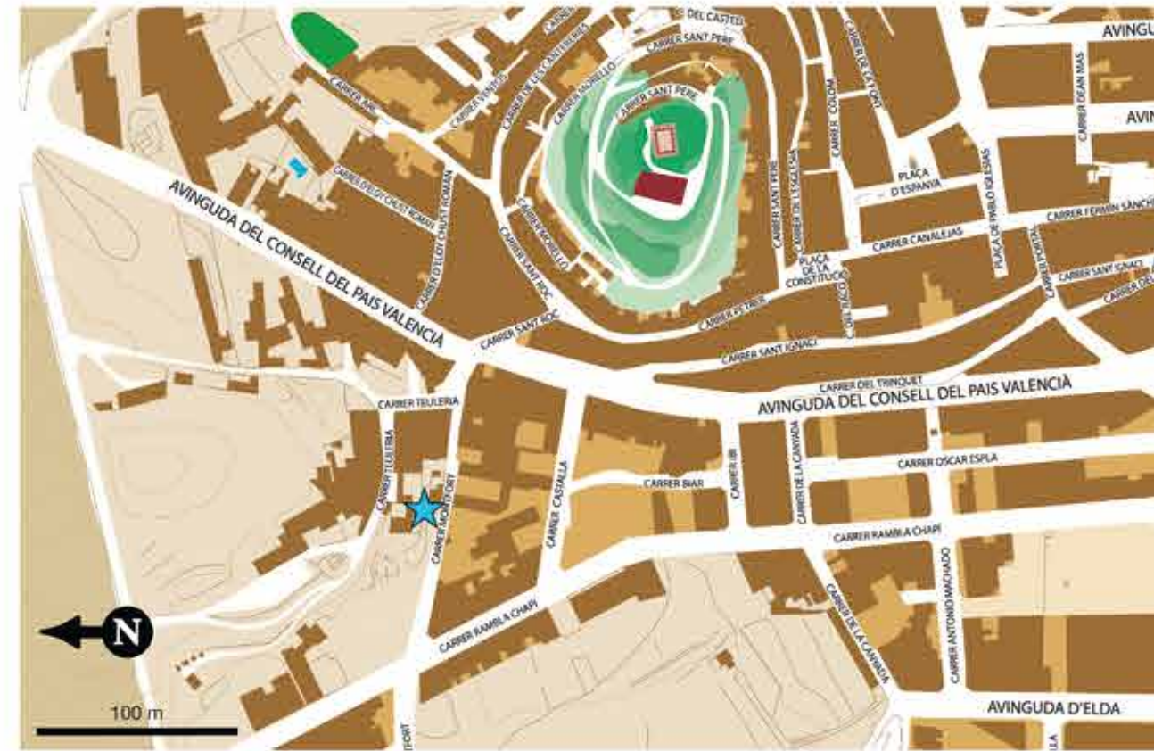
LOCALIZACIÓN DEL MUSEO DE ALFARERÍA DE AGOST, DONDE SE ENCUENTRA LA SALA DE PALEONTOLOGÍA Y GEOLOGÍA

Martes a sábado de 9:00 a 15:00 Domingo de 10:00 a 14:00 Lunes y festivos cerrado. Visitas guiadas para grupos en castellano, valenciano e inglés. Concertación previa. Dimarts a dissabte de 9:00 a 15:00 Diuenge de 10:00 a 14:00 Dilluns i festius tancat. Visites guiades per a grups en valencià, castellà i anglès. Concertació prèvia. Tuesday to Saturday 9:00 - 15:00 Sunday 10:00 - 14:00 Monday and Bank holidays closed. Guided tours for groups in English, Spanish and Valencian. Previous agreement. Mardi au samedi de 9:00 à 15:00 Dimanche de 10:00 à 14:00 Lundis et jours fériés fermés. Visites guidées pour groupes en espagnol, valencien et anglais. Accord préalable.