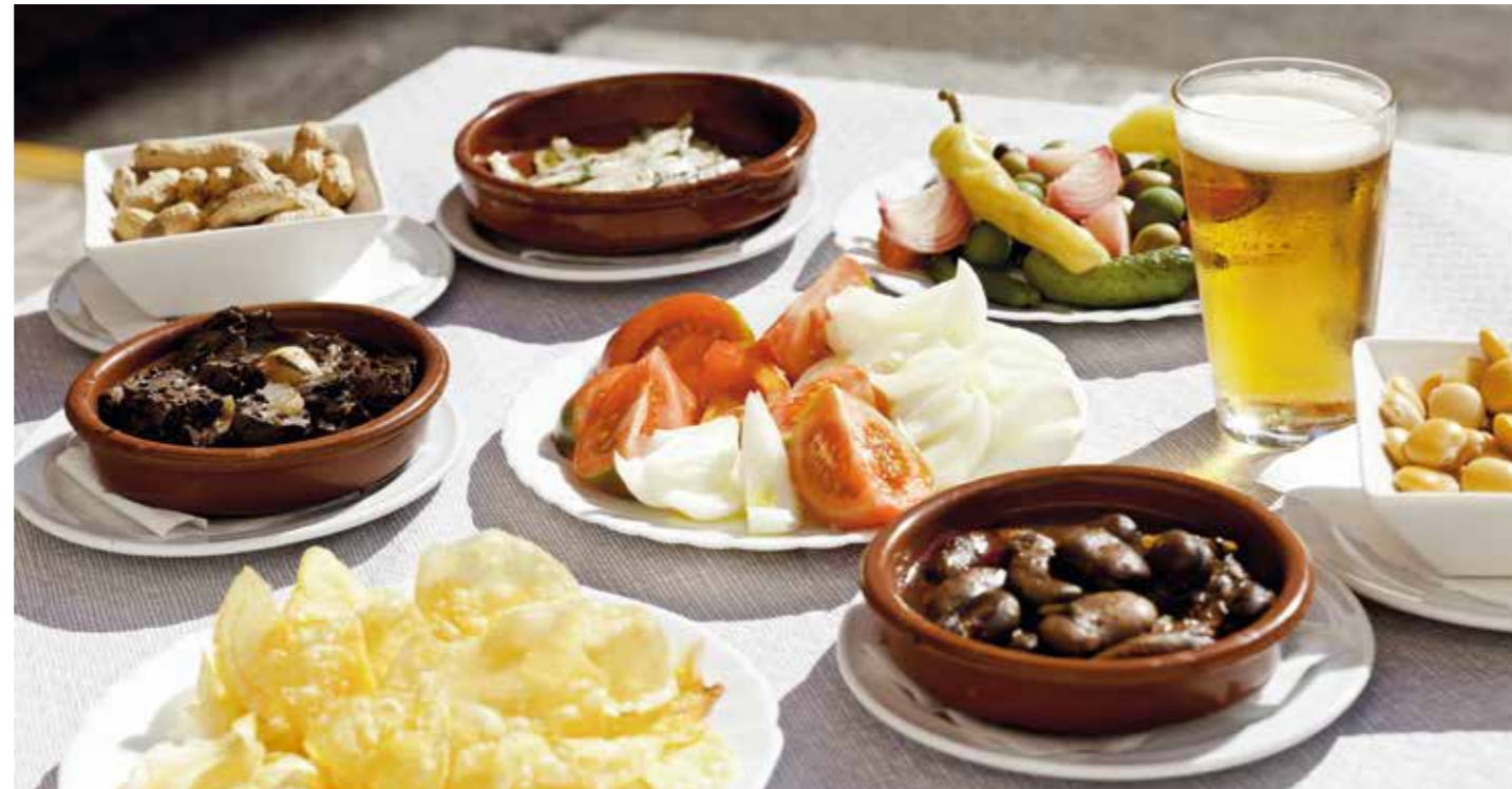
EN ALCALALÍ PODEMOS SORPRENDERNOS AL ESCUCHAR A LA GENTE MAYOR PEDIR EN UN BAR: "GAMBA I BLEDA" (GAMBAS Y ACELGAS) O UN PLATO DE "FULLES DE LLIMERA" (HOJAS DE LIMONERO), PARA REFERIRSE AL TRADICIONAL APERITIVO DE CACAHUETES Y ALTRAMUCES O A LAS PAPAS FRITAS QUE ACOMPAÑAN LA CERVECITA O EL VINO. COSAS DE ANTES QUE SE MANTIENEN AHORA

Si se viaja en familia es una apuesta segura para que los peques se diviertan imaginando tiempos de corsarios y piratas.