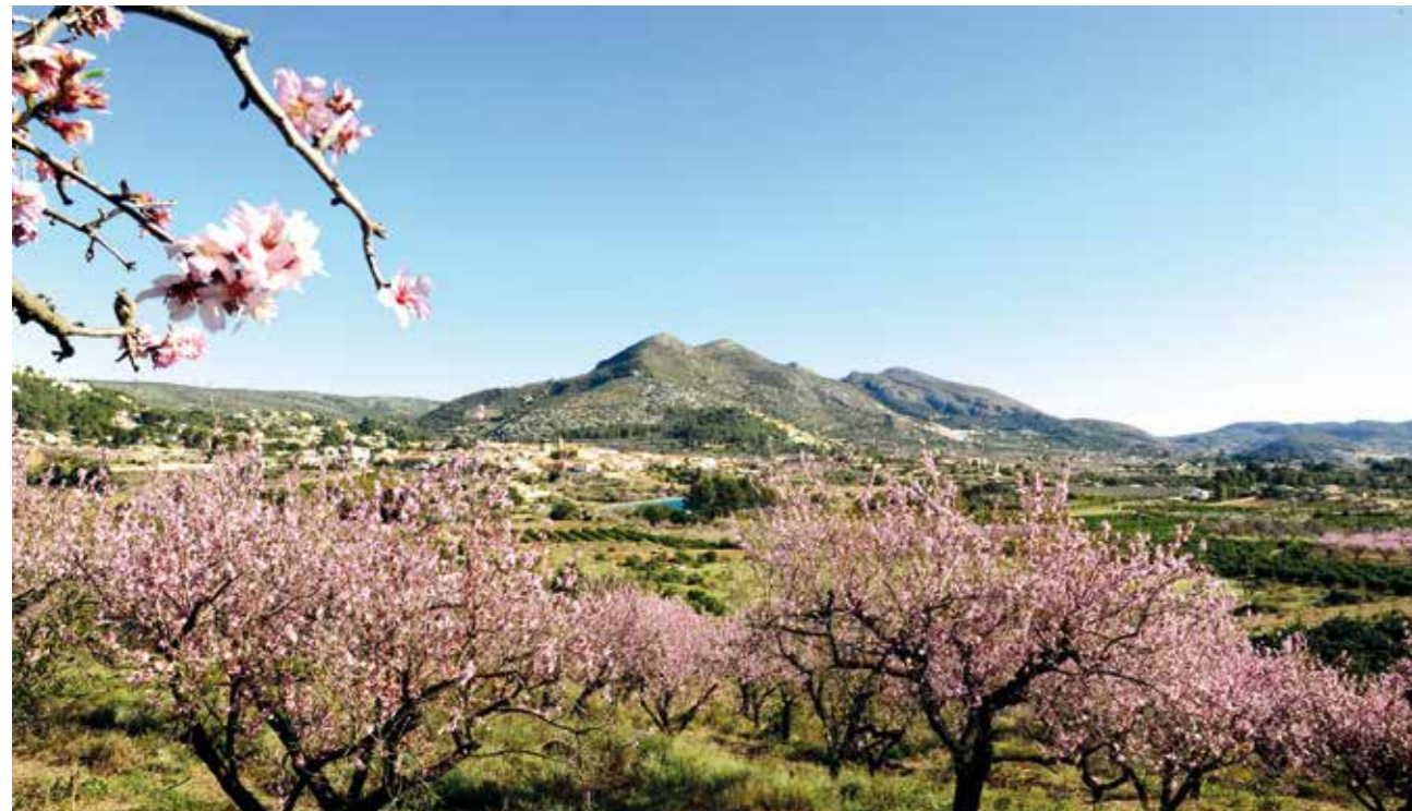
LAS TEMPERATURAS DETERMINAN CADA AÑO EL INICIO DE LA FLORACIÓN DE LOS ALMENDROS. UN ESPECTÁCULO NATURAL NO PROGRAMADO

Alcalalí se encuentra junto al río Xaló y al abrigo de las sierras del Coll de Rates, el Cavall Verd y el Seguilí.