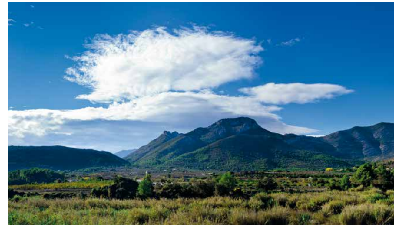
DESDE LA CIMA DEL COLL DE RATES PODEMOS IMAGINAR LA ENTRADA DE CORSARIOS DESDE EL MAR Y DEJARNOS IMPRESIONAR POR LAS SIERRAS DE BERNIA Y DEL FERRER

El entorno de Alcalalí se define por los relieves montañosos que lo abriga, pero también por los continuos contrastes entre la vegetación de ribera de los márgenes del río, el matorral mediterráneo y el mosaico de colores que conforman las zonas de cultivo, especialmente el de los almendros en flor.