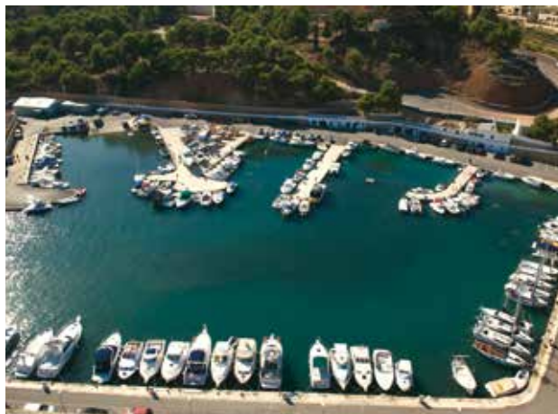
PUERTO DEPORTIVO PORTO SENSO Ptda. La Galera, 1 · T. 965 845 944