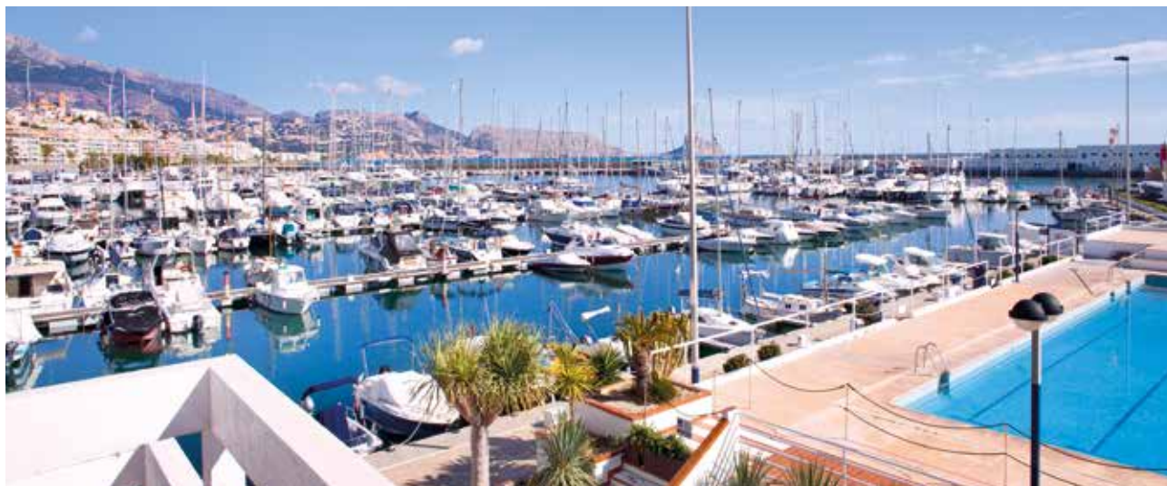
CLUB NÁUTICO DE ALTEA Av. del Puerto, 50 · T. 965 841 591