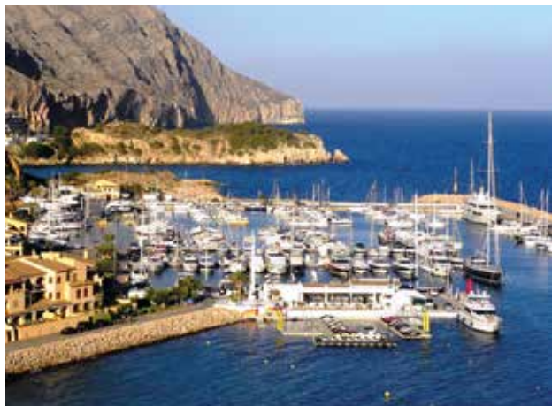
CLUB NÁUTICO CAMPOMANES (MARINA GREENWICH) · T. 965 842 200